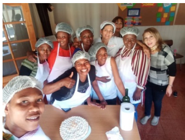
Taller Repostería Hnas. Haitianas