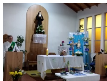
Mes de María Misionero 2019