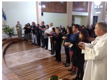
Institución Ministros Extraordinarios de la Comunión